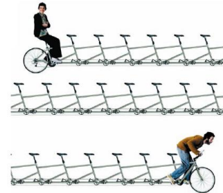
XXIX Festa de la bicicleta (2011) amb una pedalada popular a Badalona i cartell promocional de la Diputació de Barcelona promocionant la llera recuperada del riu Besòs